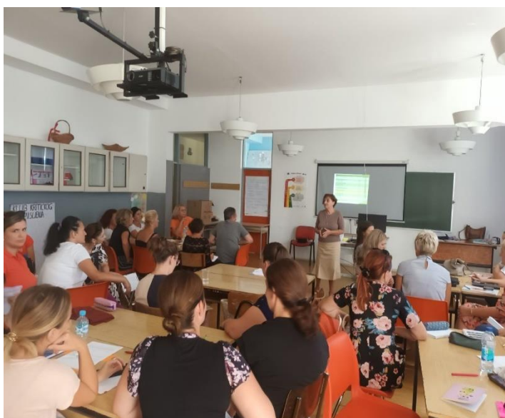
Школа домаћин савјетовања: ЈУ ОШ „Србија“ Црквина, Шамац