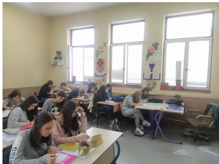
Ученици на часу одјељенске заједнице пишу писма родитељима