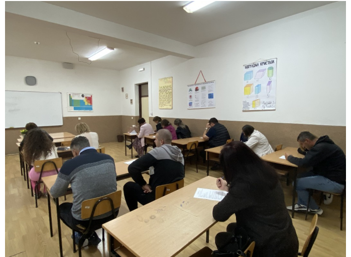
Родитељи испуњавају анкету на тему родитељских очекивања