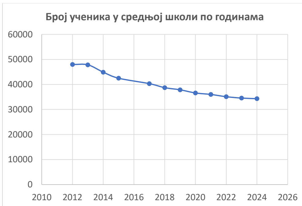
График 1. Број ученика средњих школа у периоду 2012-2024. година

Највише ученика похађа четворогодишње средње стручне школе 68%, трогодишње стручне школе похађа 15% ученика, а гимназије 17% ученика (График 2).