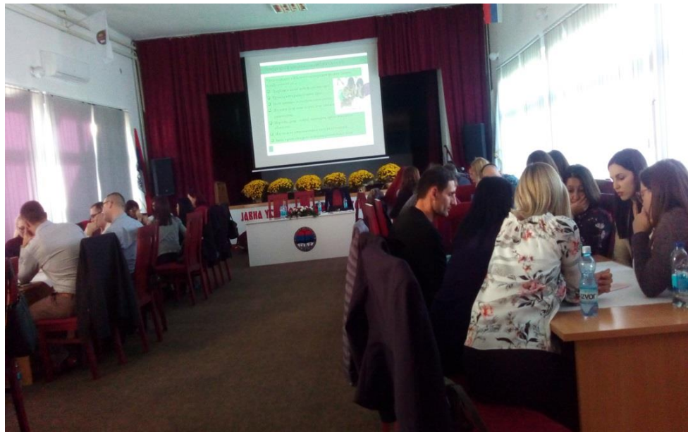
Припреме за извјештавање и извјештавање резултата рада у групи