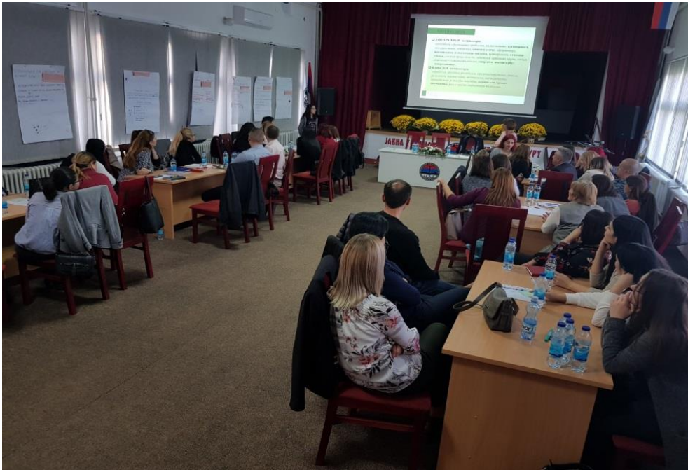
Презентације водитеља продуженог боравка „Примјери добре праксе-мотивација дјеце у продуженом боравка“