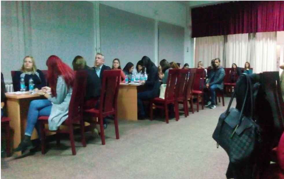
Вјежба: „Вртешка“ – тимски рад водитеља